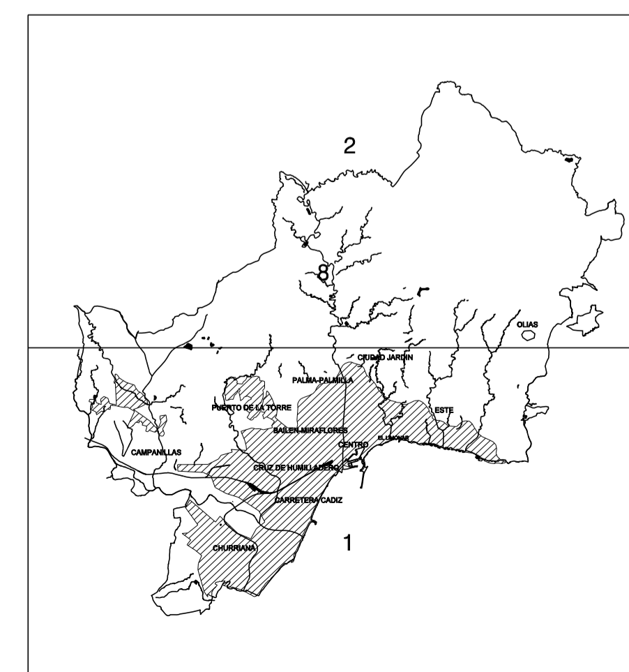
GRAFICO DISTRIBUCION DE HOJAS